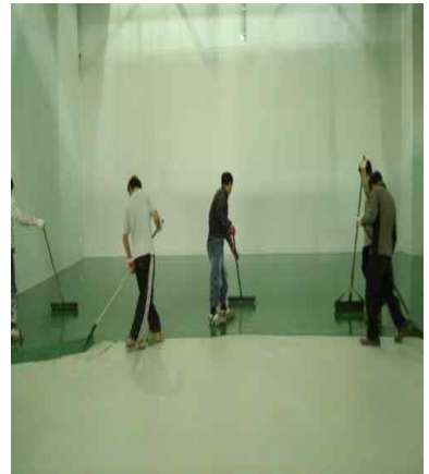
Polymor US 2차 도포 (스파이크롤러를 활용 기포 제거)