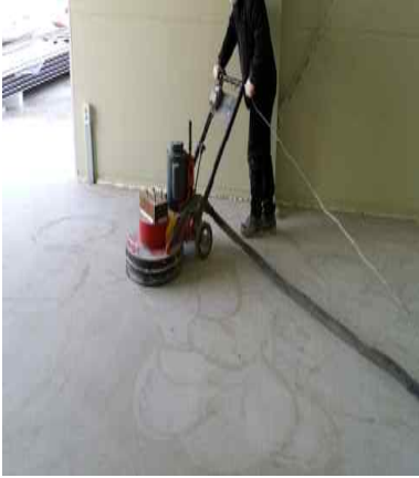
콘크리트 표면 그라인더연삭