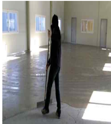
Polymor US 1차 도포 (1차 Scratch coating)