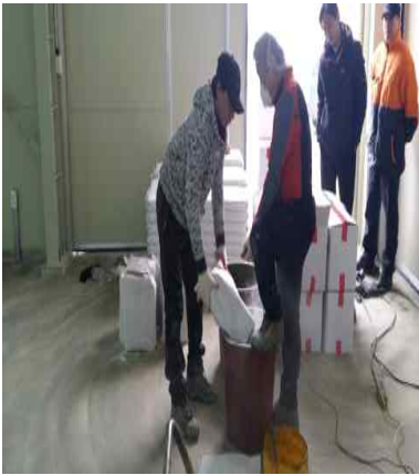
Polymor US 교반